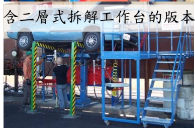
含二層式拆解工作台的版本