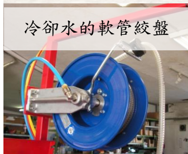
冷卻水的軟管絞盤